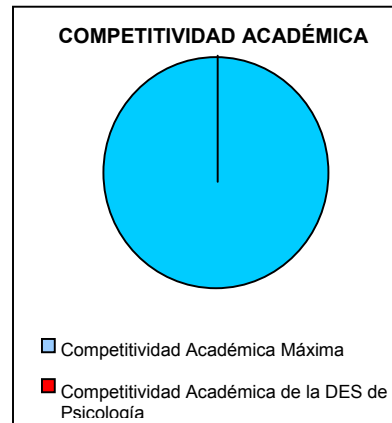
Figura 2. Competitividad Académica

El programa educativo de la Licenciatura en Psicología, fue evaluado por los CIEES en mayo de 2001, fue ubicado en el nivel 2. En junio de 2002 se recibieron las recomendaciones, para su atención y se integró un comité en el que participan PTC y PA.